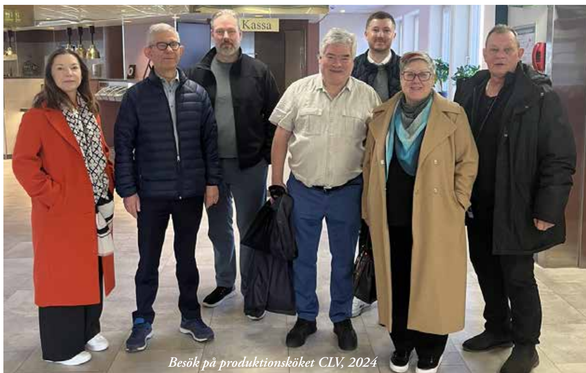
Besök på produktionsköket CLV, 2024